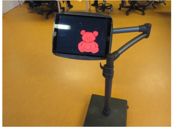
Ipad og ipadstandur