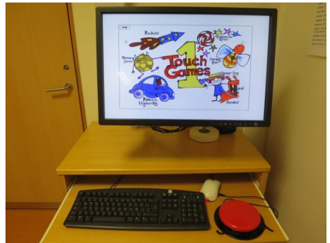
Tölva með snertiskjá